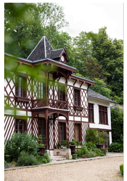
La bibliothèque Firmin Didot, illustre propriétaire du château et créateur des caractères d'imprimerie

Durant les XVIII e et XIX e siècles, plusieurs familles nobles se succèdent à la tête du château. Chaque propriétaire y apporte des modifications, notamment au niveau des aménagements extérieurs, avec la création d'un parc à l'anglaise et l'ajout de dépendances. Les jardins et bois environnants deviennent alors des lieux de promenade, reflet des tendances paysagères de l'époque.